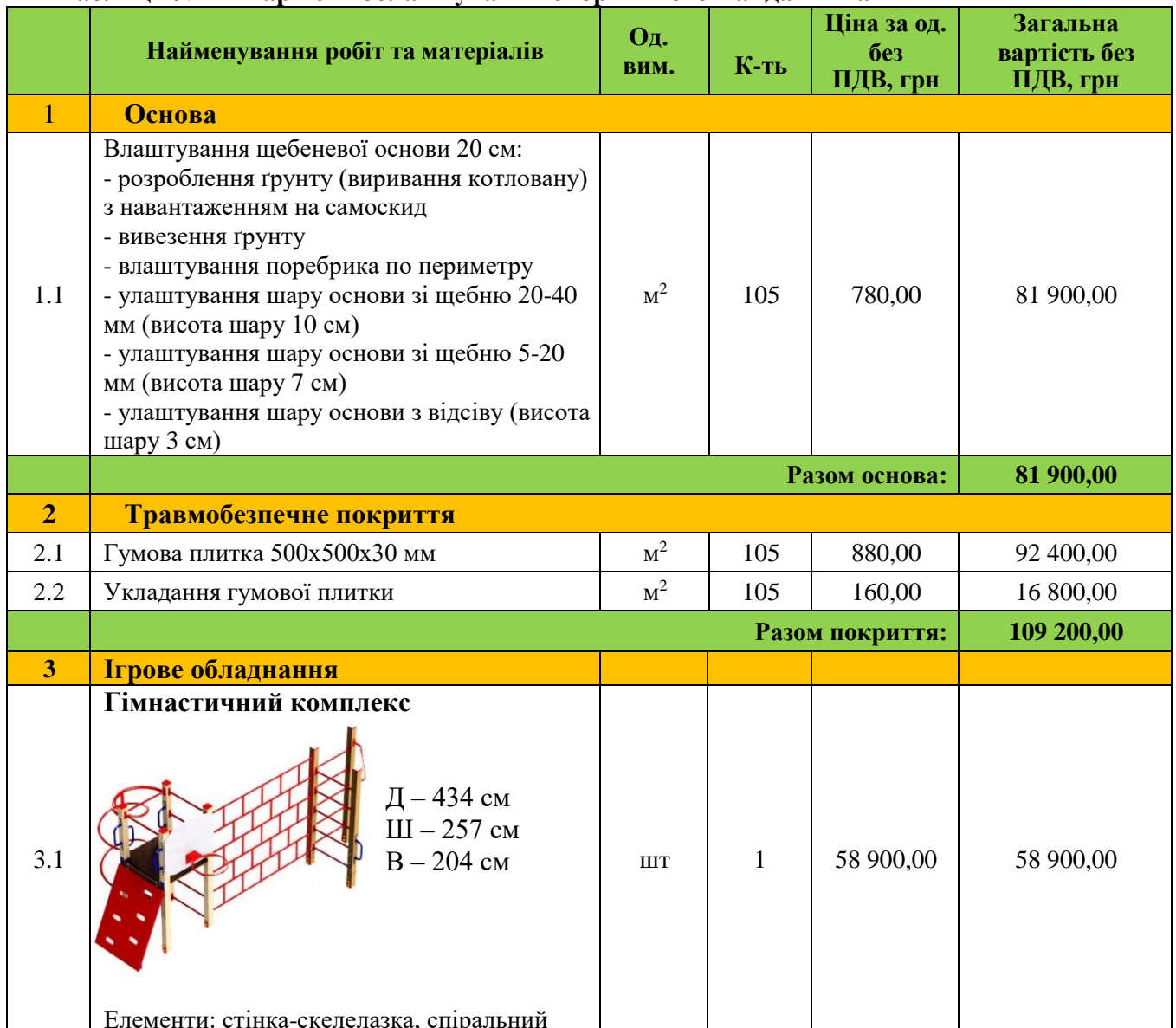
Таблиця № 1 - Вартість облаштування спортивного майданчика

Гумова плитка – це підлогове покриття, що виготовляється на основі гумової крихти і поліуретанового зв'язуючого клею. Виготовляється плитка методом холодного пресування з додавання фарбувального пігменту. Покриття є двошаровим: верхній шар виконаний з чорної SBR крихти з додаванням кольорового пігменту, а нижній (амортизуючий) шар з чорної SBR крихти, служить для зниження навантажень при контакті з гумовою плиткою.